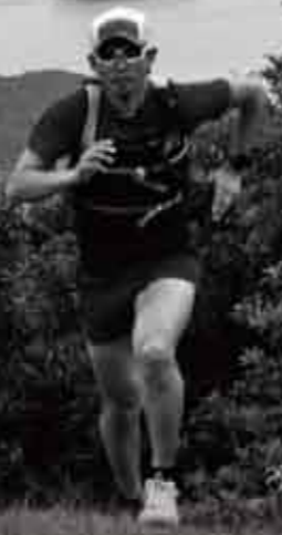
朝熊山展望台・山頂広苑付近にて