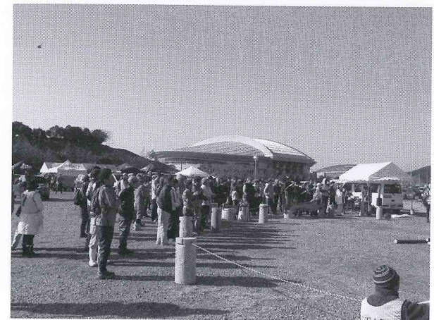
見学者はひとつひとつの作業に歓声を上げていた