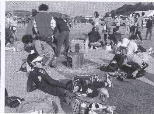
ゴールした選手達は薪ストーブで暖をとった