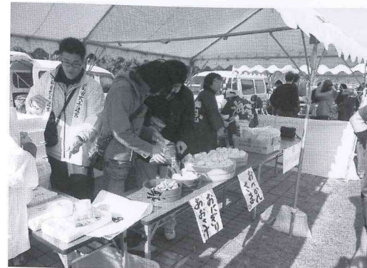
地元の食材で作ったおにぎりとおおさ汁がふるまわれた