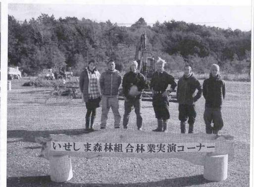
コーナーの担当者