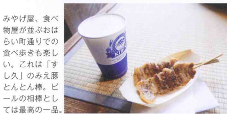
みやげ屋、食べ物屋が並ぶおはらい町通りでの食べ歩きも楽しい。これは「すし久」のみえ豚とんとん棒。ピールの相棒としては最高の一品。