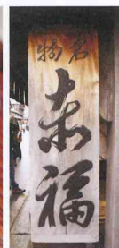
赤福もいろいろけど、冬は温まる赤福ぜんざい(500円)がオススメ。赤福内宮前支店（もしくは本店向かい店舗）で食べられる。夏場は赤福が氷の中に詰められた赤福水にメニューが替わる。