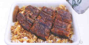
伊勢市駅方面にある持ち帰りうなぎ弁当「淡水」。国産うなぎを一匹一匹でいねいに焼いてくれる。写真は「上3切れ」でキモの吸い物付き1250円。