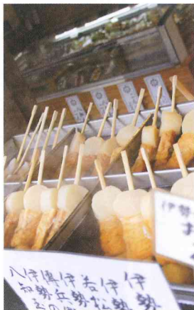
伊勢神宮の内宮に入る宇治橋まで、五十鈴川に沿って続く約800mのきれいな石畳のおはらい通り。土産屋や飲食店だけでなく、神宮道場や祭主職舎などの歴史的建造物なども立ち並び、レトロな雰囲気が漂っている。